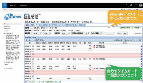
SharePointOnline サイトで利用可能