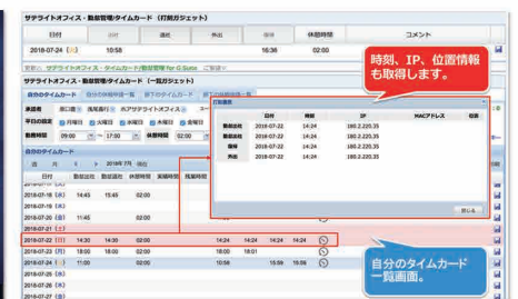
時間、IP、位置情報を取得