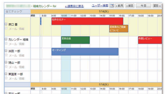
週ビューの他に、日ビューで見る事が可能