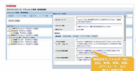
権限設定もフォルダー毎に、閲覧、新規、更新、削除、ダウンロードなど細かく制御可能