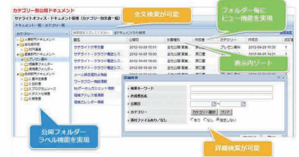
全文検索、詳細検索が可能、フォルダー毎にビュー機能を実現 公開フォルダーラベル機能を実現