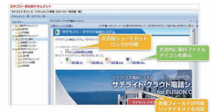
文書間ショートカットリンクが可能、文書内に添付ファイルアイコンを表示、各種フィールドが可能リッチテキストも可能