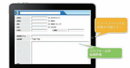
スマートデバイスでも利用可能、入力フォームも自由作成