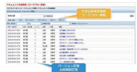
文書公開認証機能、ワークフロー機能 バージョン管理、公開期間管理