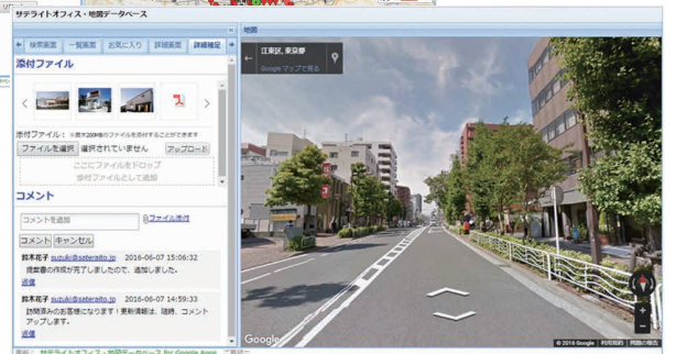
Googleマップと同じ、ストリートビュー、渋滞情報、地下鉄情報も表示可能です! また、添付ファイル可!

CSV(フォーマットは自由)をアップロードしていただくだけで、地図データベースが完成!